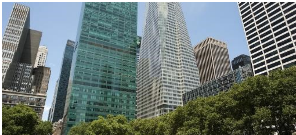
Foto: Blackstone vende a precio récord torre de oficinas ubicada en Nueva York