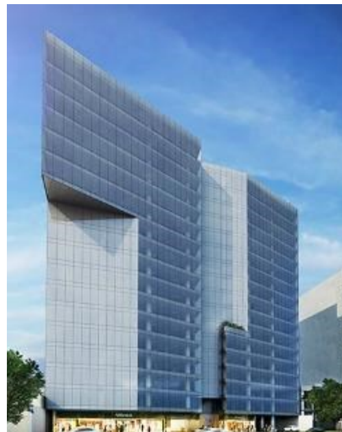
Render edificio de oficinas en Magdalena del Mar

Paniagua detalla que tres de ellos son edificios de oficinas y tienen entre 18 y 22 pisos en los distritos de San Isidro, Magdalena y Miraflores. Mientras que los de viviendas bordean los 17 pisos y están en plazas céntricas como Miraflores, La Victoria y Pueblo Libre.